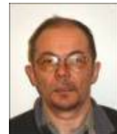
Nils Oskar Anti N.Leder OOK