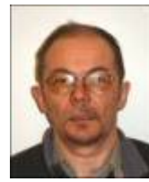
Nils Oskar Anti N.Leder OOK