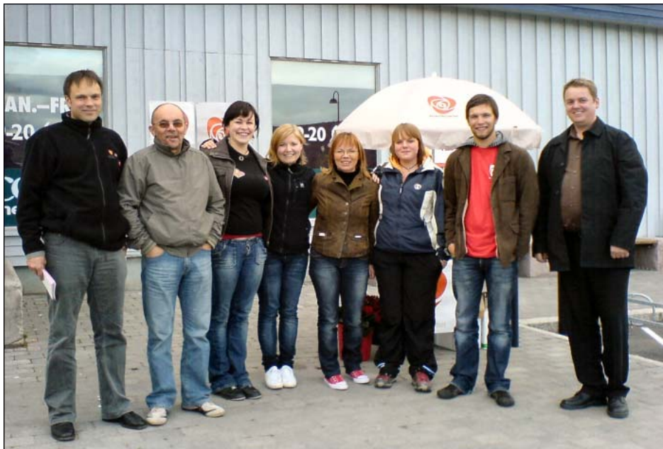
Valgkampstand utenfor Coop Mega Tana den 31.august 2007

Tana arbeiderparti på nett: www.tanasiden.com/ap