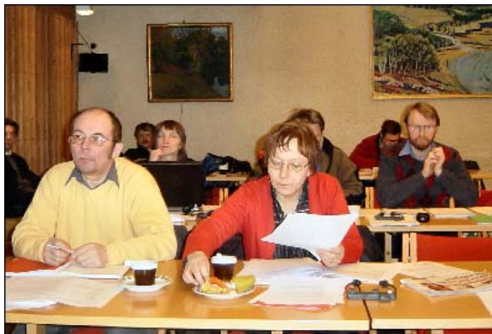
Kommunestyremøte juni 2008

Jeg vil takke kommunestyregruppene for året som er gått siden forrige årsmøte. Jeg vil også takke de som er gått ut av kommunestyret for jobben de har gjort i perioden. Det er mye arbeid å være kommunepolitiker og det ligger mange timers forberedelser før hvert møte. Det har vært et spennende år hvor Arbeiderpartiet var i opposisjon frem til konstitueringen etter valget. Mange av vedtakene i kommunestyret har vært preget av at det har vært valgår.